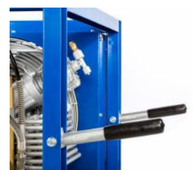
Sturzrahmen inkl. Tragegriffe

Der Sturzrahmen bietet zusätzlichen Schutz der Anlage und erlaubt mit den integrierten und ausklappbaren Tragegriffen einen einfachen und komfortablen Transport.