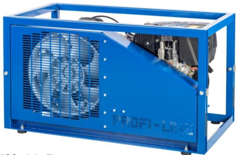
PROFI-LINE II-D Standardausführung