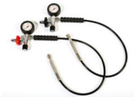
Fülleinrichtung PN200 bzw. PN300